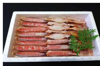
商品 No. 3～4 カニスキセット 写真は約2～3人前