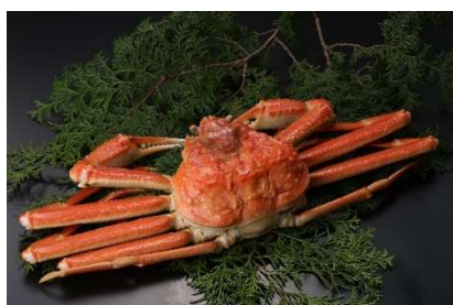
商品 No. 2 訳あり浜茹で松葉