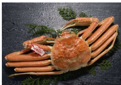
商品 No. 1 タグ付き浜茹で松葉